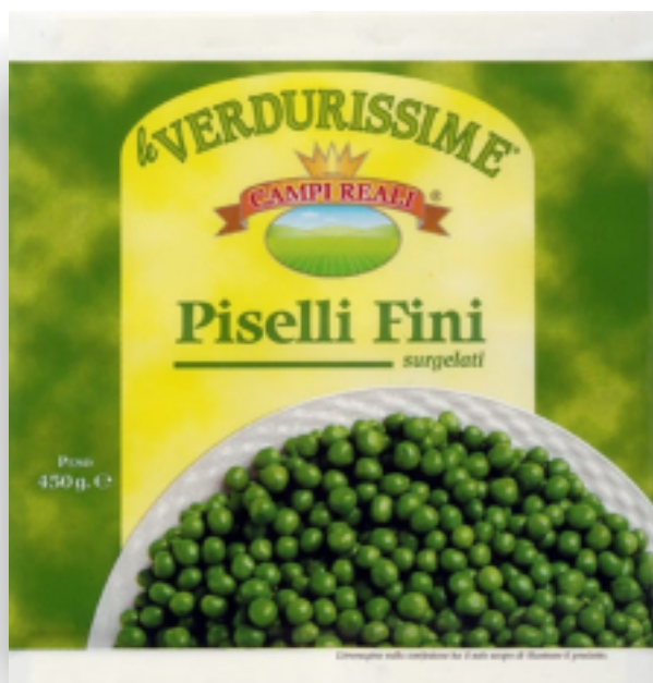
Piselli Fini gr.450x8 GR 3934