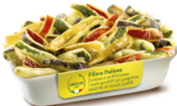
Stick Tris Pastellato Kg. 1x4 GC4008

Realizzati selezionando cuori di carciofo rivestiti da una croccante pastella. Una scelta versatile e di qualità per aperitivi, antipasti e l'allestimento di buffet e banchetti. Per friggitrice e forno.