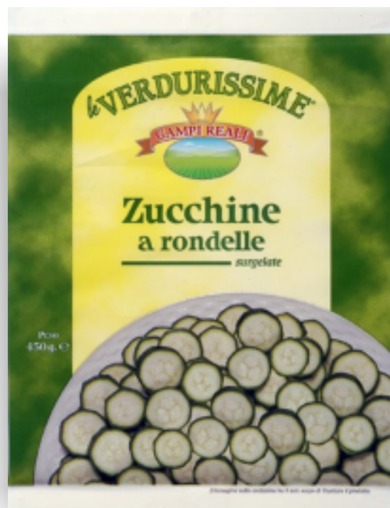
Zucchine a Rondelle gr.450x8 GR 3946