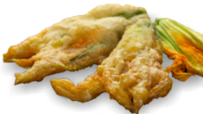
Fiori di Zucca pastellati Kg. 1,5x2 - gr. 25 cad. GC4232

La soluzione perfetta per creare proposte leggere: patate , carote e zucchine croccanti e di grande impatto visivo come appetizer sfiziosi per aperitivi o contorni.