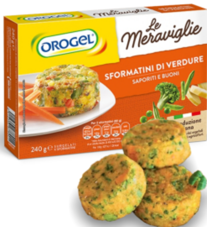
Sformatini di Verdure gr.240x10 GR 3663