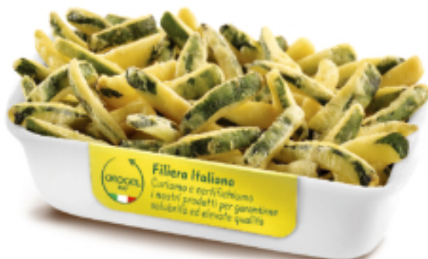
Zucchine Pastellate Kg. 1x4 GC4009

Golosi bastoncini di peperoni , melanzane e zucchine , croccanti e gustosi, da utilizzare negli happy hour o come contorno. Veloci da preparare in forno o friggitrice.