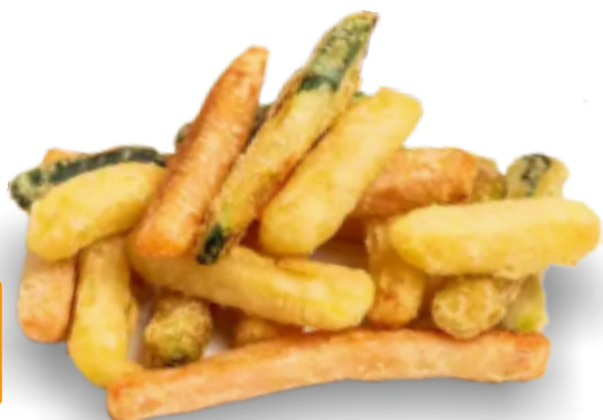
Tris di Verdure in Tempura Kg. 1x4 Gc4020

La soluzione perfetta per creare proposte leggere: patate , carote e zucchine croccanti e di grande impatto visivo come appetizer sfiziosi per aperitivi o contorni.