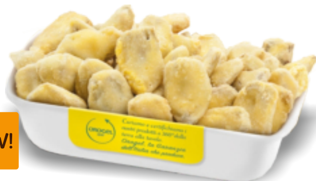
Carciofi Pastellati Kg. 1x4 GC4010

Realizzati selezionando cuori di carciofo rivestiti da una croccante pastella. Una scelta versatile e di qualità per aperitivi, antipasti e l'allestimento di buffet e banchetti. Per friggitrice e forno.