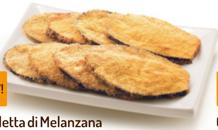
Cotoletta di Melanzana Kg. 1x4 GC4011

Sottili fette di melanzane in una croccante panatura per un prodotto ricco e dall'ottima resa in cottura. Si prestano a tantissime occasioni: aperitivi, buffet, finger food e contorni. Anche in forno.